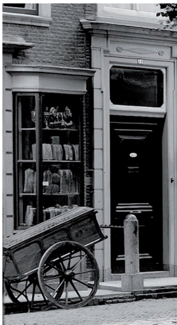
20 Eind negentiende eeuw had de Roggebroodbakkerij op Hooigracht 72 een etalagekast.