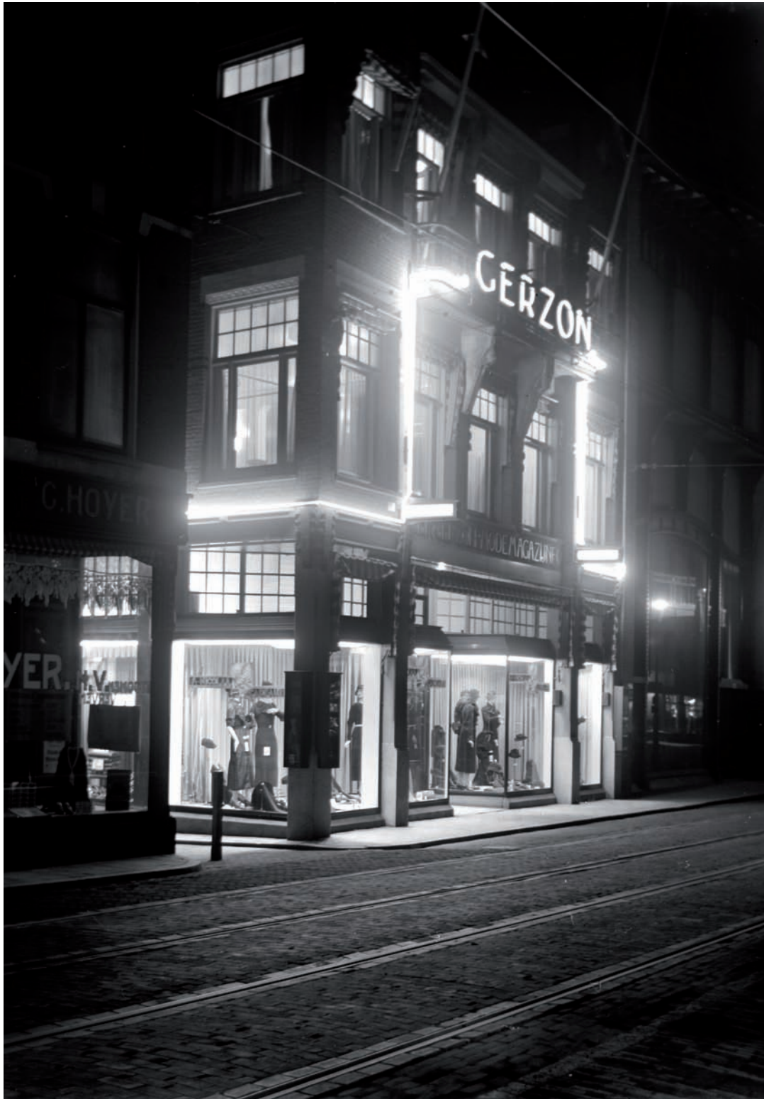
10 Winkelpand van de firma Gerzon in de Breestraat bij avond in 1934.