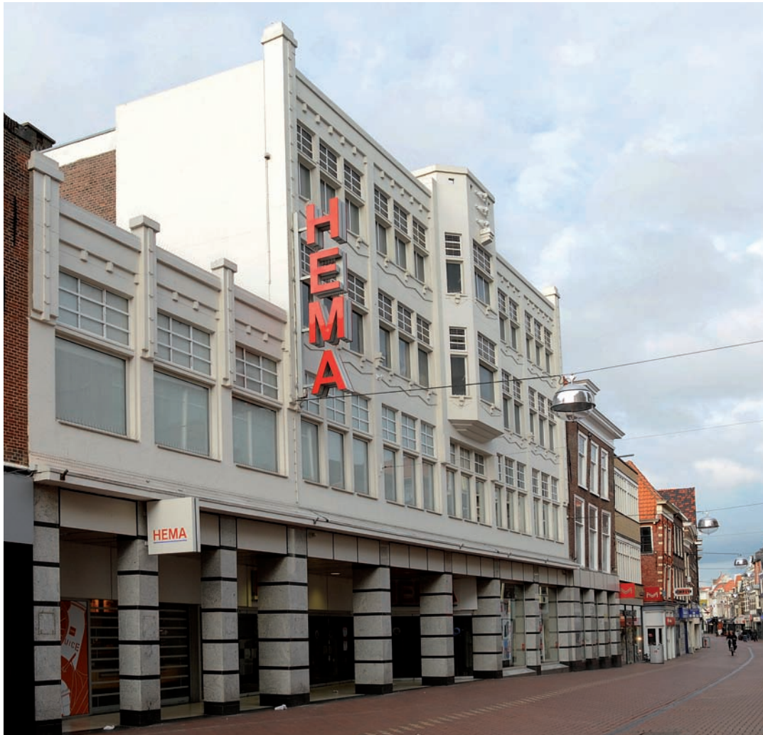
30 Voorgevel van warenhuis Hema, Haarlemmerstraat 130-136.

lichtkap op een metalen draagconstructie. Vloeren en wanden van het trappenhuis zijn voorzien van kostbare materialen als brons, wit en zwart marmer; de vensters hebben glas-in-loodbeglazing. De hele afwerking ademt nog de grandeur van de negentiende-eeuwse kooppaleizen met hun pracht en praal. De buitengevels zijn eveneens voorzien van duurzame materialen, van vensteromlijstingen en natuursteen reliëfs. De 27 meter hoge opengewerkte toren aan de Aalmarkt versterkt de monumentaliteit van het geheel. De gevel van de parterre is transparant, als een doorlopende etalage onder een luifel. Etalages