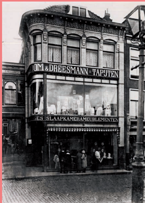
7 Winkelpand 'De Zon' van Vroom & Dreesmann, Aalmarkt 26-29, in 1904.