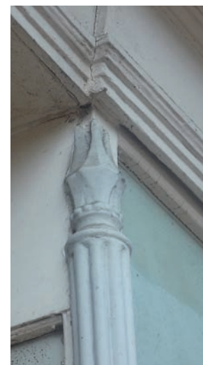
24b Gietijzeren detail van de etalagekast van Botermarkt 26.