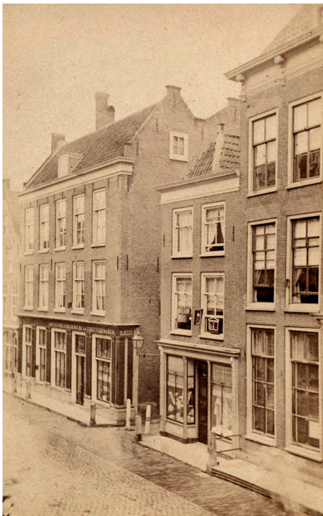
21 Naar binnen geplaatste entree bij een winkelpui in de Haarlemmerstraat omstreeks 1865.

te lokken. Veel houten onderpuien waren echter al vervangen door bakstenen ondergevels met een enkele deur en losse raamkozijnen. De puibalk bleef in veel gevallen nog gehandhaafd, maar luifels en luiken waren verdwenen en daarmee ook de mogelijkheid om waar uit te stallen. Ter compensatie zette men de toegangsdeur in het midden van de gevel uitnodigend open, en dat is ook voor het moderne winkelende publiek een vertrouwd beeld.