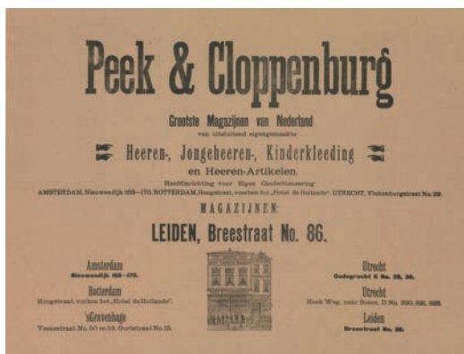
27 Advertentie uit 1890 voor Peek & Cloppenburg.

het eerste kwart van de twintigste eeuw door samenvoegingen een aaneenschakeling van winkelpanden geworden. Het gevolg was een labyrint van gangen en doorloopjes tussen de verschillende bouwdelen. Later bouwden onder meer Peek & Cloppenburg en Vroom & Dreesmann er hun afzonderlijke warenhuizen (afb. 26-29). De eerste warenhuizen in Nederland waren in de traditie van de buitenlandse voorbeelden luxueus ingericht en georiënteerd op de welgestelde bovenlaag. In 1926 startte de Bijenkorf als tegenhanger van al deze luxe voor de mensen met een kleinere beurs de Hollandse Eenheidsprijzen