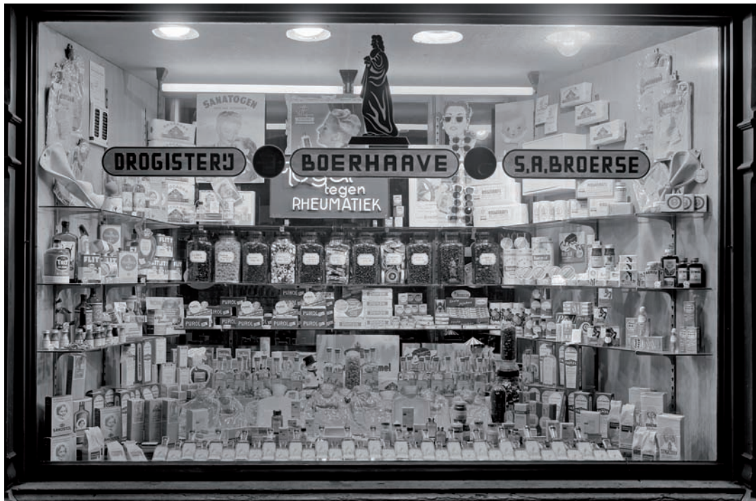
8 Etalage omstreeks 1950 van de nog steeds bestaande drogisterij Boerhaave, Haarlemmerstraat 68.

Parijs liep voorop. Daar werd in 1852 een warenhuis geopend dat zorgde voor een ware revolutie in het winkelen. De talloze artikelen werden aangeboden tegen vooraf vastgestelde prijzen. Bovendien konden klanten zonder enige verplichting binnenlopen en de koopwaar bekijken. De winkel straalde een grandeur uit die de consument uitnodigde tot een bezoek.