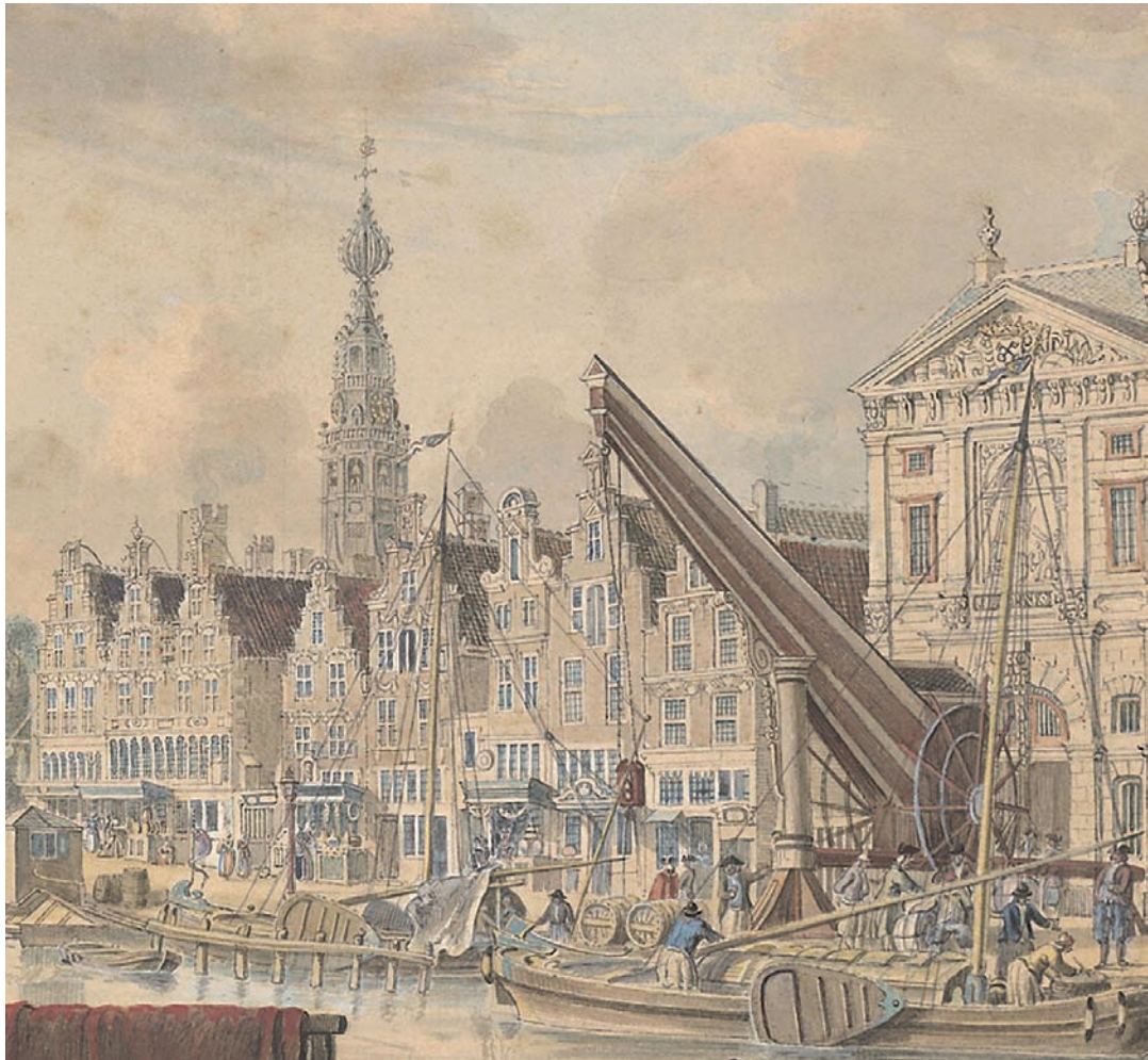
17 Gezicht op de Aalmarkt in 1753: de winkels hebben vaste luifels en er is handel op straat. Detail uit een tekening van J. de Beyer.

banken voor het huis of op neergeklapte luiken van de houten onderpui in de voorgevel. Omdat in veel middeleeuwse huizen zowel gewoond als gewerkt moest worden, was er behoefte aan veel daglicht. De houten gevels werden opgebouwd uit een stijl en regelwerk, waardoor rechthoekige vakken ontstonden die naar believen konden worden ingevuld. Vanwege de hoogte werden de houten puien met kozijnstijlen en dorpels in vakken verdeeld. De bovenste vakken werden in het algemeen voorzien van glas-in-loodbeglazing; via de onderste, die geheel open waren, had men contact met de straat. Deze vakken konden worden afgesloten