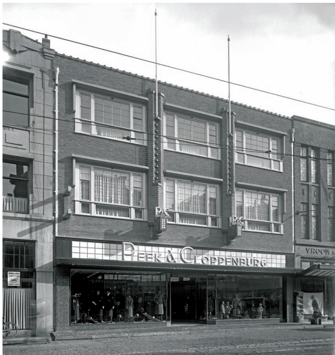
29 Het in 1933 nieuw gebouwde winkelpand van Peek & Cloppenburg, Breestraat 78-80, naar ontwerp van architectenbureau L.F.C. Gathier uit Utrecht. Ter plaatse stond de voormalige sociëteit Amicitia.

Maatschappij Amsterdam ofwel HEMA. In Leiden werd in 1937 de 23ste HEMA-vestiging geopend in de Haarlemmerstraat 130-136 – een logische locatie gezien het klassenverschil tussen de duurdere Breestraat en de goedkopere Haarlemmerstraat. De bijzondere art deco voorgevel van dit winkelpand, dat oorspronkelijk was gebouwd voor Manufacturenmagazijnen Waals, stamt uit 1930 en telt vier bouwlagen. In Leiden zijn slechts weinige