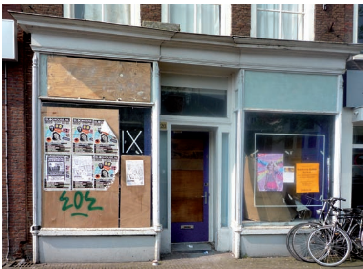
24a Winkelpui met dubbele etalagekasten op Botermarkt 26.

De plint onder de etalagekast bleef in eerste in- stantie in het gevelvlak staan en de kasten rustten op vrijstaande pootjes. Dit principe en de mid-