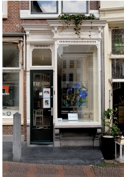
23 De etalagekast van Nieuwe Rijn 4.

rechthoekig van vorm met aan de voor- en zijkan- ten ramen, bestaande uit kleine ruitjes tussen houten spijlen. Later werden de hoekstijlen van deze kasten veelal vervangen door metaal en werden de ruiten groter.