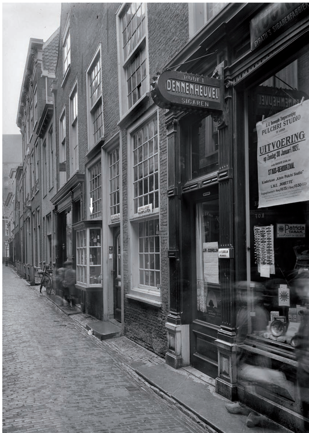
19 Etalagekast (zie pijl) bij Pieterskerkchoorsteeg 9 in 1927.