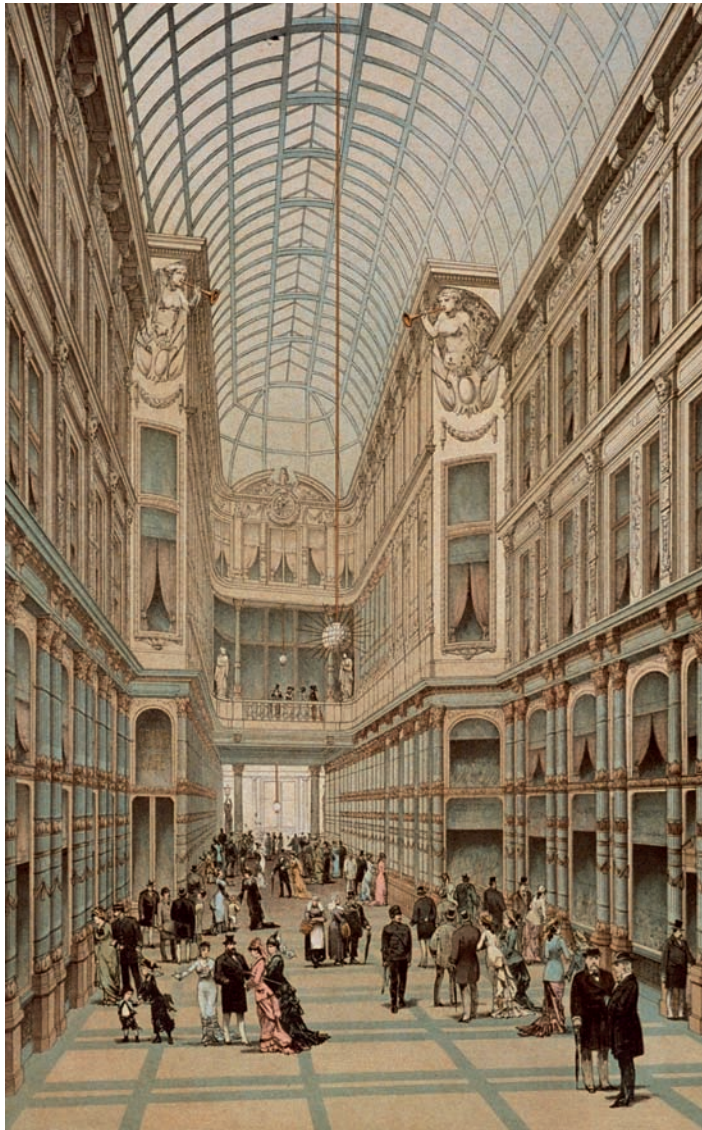
25 Interieur van de Rotterdamse passage, litho van Lankhout & Co, 1879.

winkelpui en leidend in het gevelontwerp; grote glazen ruiten voor veel doorzicht en lichttoevoer. In alle grote steden van Europa werden vanaf het eind van de achttiende eeuw passages gereali-seerd: de Royal Opera Arcade in London uit 1818 van architect John Nash, de Galerie Saint Hubert uit 1847 in Brussel, de Kaiser Galerie in Berlijn uit 1873. Parijs spande de kroon met zijn meer dan honderd grotere en kleinere passages rond het midden van de negentiende eeuw. Hiervan zijn er nog zo'n twintig bewaard gebleven waarvan de