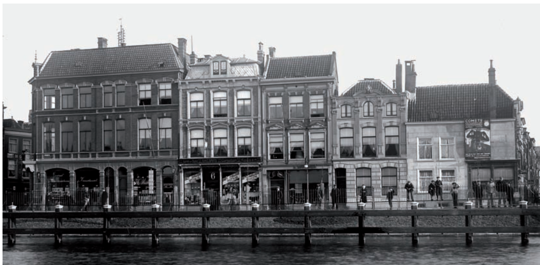
6 Winkelpanden op de Prinsessekade, voorheen de Paardensteeg, in 1909.

Ambachtslieden die hetzelfde beroep uitoefenden, hadden zich meestal georganiseerd in vakverenigingen, de gilden. Deze gilden hadden eeuwenlang een monopoliepositie, verdeelden de markt onderling en bepaalden centraal de prijzen. Doordat zij zowel de onderlinge concurrentie als de concurrentie van buitenaf strikt reguleerden, was vrije vestiging van nieuwe beroepsgenoten tot aan de negentiende eeuw vrijwel uitgesloten. Kleinschalige bedrijfjes waren over het algemeen speciaalzaken en veelal gevestigd in de buurt van collega-bedrijven. Een straatnaam als de Mandenmakerssteeg verwijst bijvoorbeeld nog naar zo'n clustering van bedrijven.