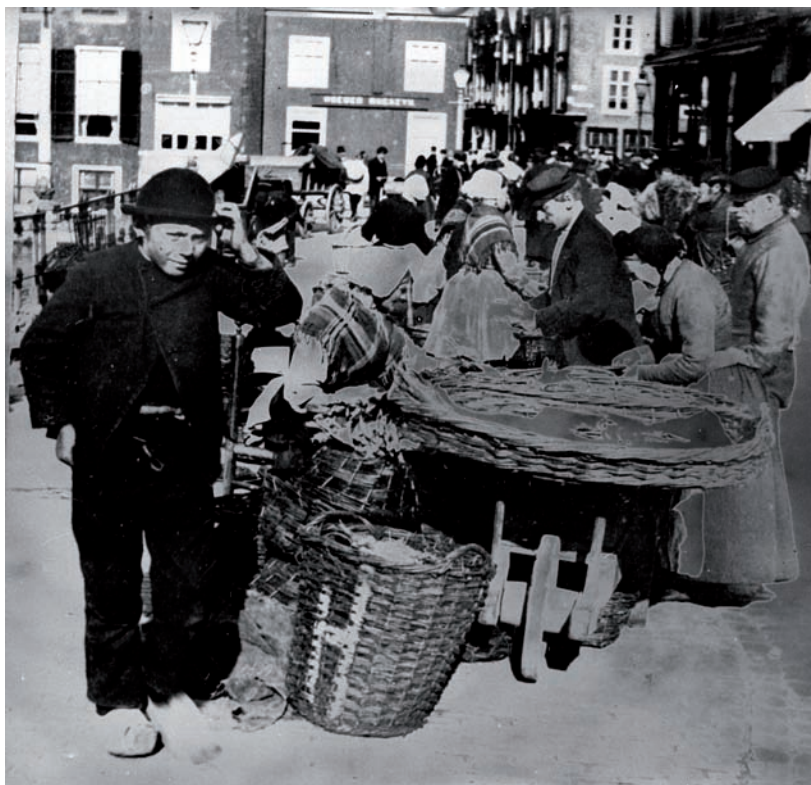
4 Markt op de Hoogstraat in 1934.

Het winkel- en marktcentrum ontwikkelde zich in het hart van de stad, op de aangeplempte gronden van de Rijn. Het gebied rond de Waag vormde al in de zestiende eeuw het handelscentrum van Leiden. Hier werden tal van goederen gewogen, en eromheen verrezen herbergen waar transacties gesloten en schulden vereffend werden. De vele marktbezoekers vormden een aantrekkelijke klantengroep voor winkeliers. Rond de markten en doorgaande straten als de Breestraat en Haar-