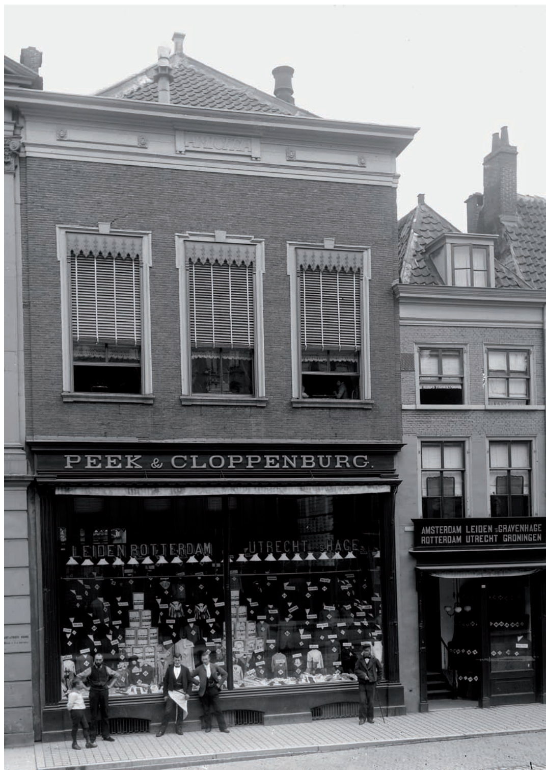
26 Het eerste pand van Peek & Cloppenburg, Breestraat 86, in 1885.