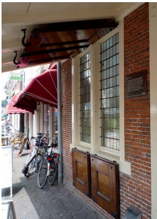
15 Voorbeeld van een luifel en verticaal uitgeklapte buitenluiken in Oudewater.

mere bevolkingsgroepen – tegenwoordig zijn deze voor iedereen een geliefde vrijetijdsbesteding. De bepalende rol van markten in Leiden is inmiddels overgenomen door de winkels, maar de wekelijkse markten in de stad worden nog altijd druk bezocht. Deze zijn te vinden op de Vismarkt en langs de Nieuwe Rijn tussen de Karnemelksbrug en de Hoogstraat: een historische marktlocatie.