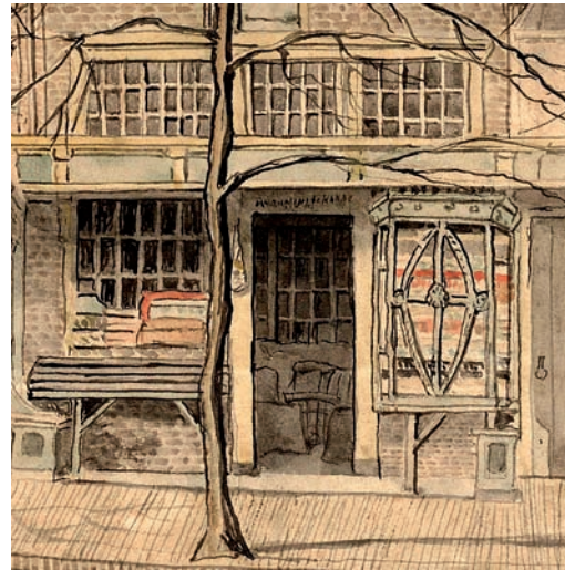
18 Houten vitrinekast op buitenluiken in Alkmaar in ca. 1819. Detail uit een tekening van J.A. Crescent.

Hoewel dergelijke onderpuien, al dan niet met luifel, ook in Leiden veelvuldig voorkwamen, zijn er geen exemplaren bewaard gebleven. Ze zijn nog wel te zien op een schilderij van J. de Beyer uit 1753 met zicht op de Hoogstraat en Aalmarkt (afb. 17). Ook vandaag de dag nog worden winkelpuien voorzien van luifels, die de overgang vormen tussen buiten en binnen en zich goed lenen voor reclamedoelinden. Voorbijgangers kunnen zelfs met slecht weer de etalage bewonderen en zetten zo bij wijze van spreken al de eerste stap in de winkel. Met name Vroom & Dreesmann kent een lange traditie van etaleren. Vooral rond kersttijd gunt het publiek zich de tijd om onder de brede luifels de feestelijk ingerichte etalages te bewonderen.