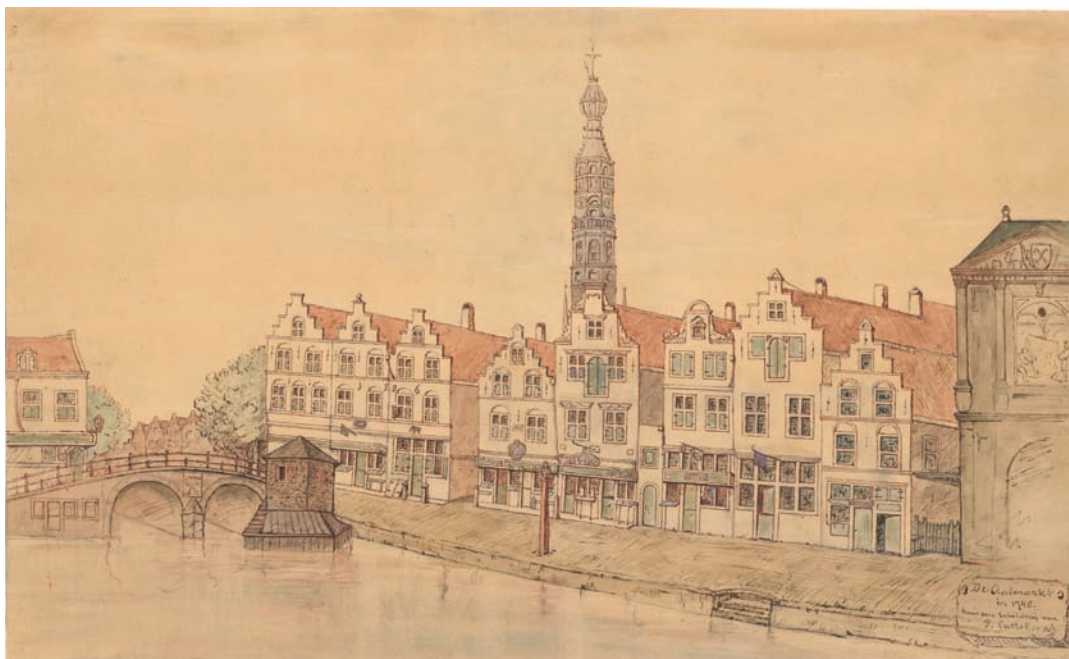
5 Gezicht op de Waag en Aalmarkt in 1748, tekening door P. Cattel.

lemmerstraat vestigden zich daarom ook al vroeg verschillende neringdoenden.