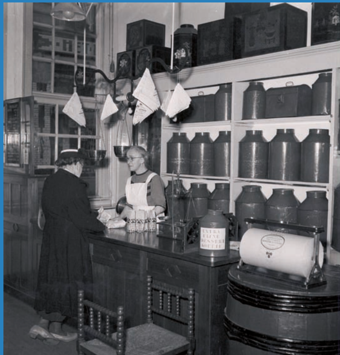
12 Het winkelinterieur van Koffie en Theehandel 'Het Klaverblad' aan de Hogewoerd 15 in 1952.

Een ander gevolg van de beperkte concurrentie was geringe aandacht voor interieur en uiterlijk van de winkel. Een winkel bestond in die tijd voornamelijk uit een opslagruimte met artikelen in dozen en grote stellingkasten (afb. 12). De geslo-