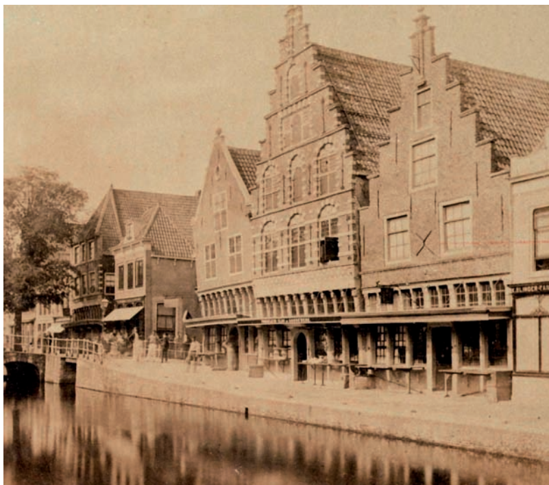
16 Winkelhuizen met luifels en buitenluiken op het Luttik Oudorp in Alkmaar omstreeks 1869.

De verkoop van uiteenlopende goederen was in vroeger tijden vooral in handen van straathandelaars. Zij vervoerden hun waar op de rug of met karren en beschikten soms over kleine kraampjes of stalletjes waar de handel plaatsvond (afb. 14). Verder werd ook veel handel gedreven vóór de huizen in de stad. De voorkamer of het voorhuis van de woning was in gebruik als werkplaats of atelier en de veelal zelfgemaakte producten werden ter plaatse verkocht. De openbare straat en de stoep vormden het winkelgebied waar de handelswaar werd uitgesteld, veelal op losse toon-