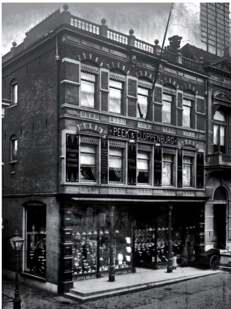
28 Nieuwe winkelpui van Peek & Cloppenburg, Breestraat 76, in 1890 ontworpen door J. van der Heijden.

het eerste kwart van de twintigste eeuw door samenvoegingen een aaneenschakeling van winkelpanden geworden. Het gevolg was een labyrint van gangen en doorloopjes tussen de verschillende bouwdelen. Later bouwden onder meer Peek & Cloppenburg en Vroom & Dreesmann er hun afzonderlijke warenhuizen (afb. 26-29). De eerste warenhuizen in Nederland waren in de traditie van de buitenlandse voorbeelden luxueus ingericht en georiënteerd op de welgestelde bovenlaag. In 1926 startte de Bijenkorf als tegenhanger van al deze luxe voor de mensen met een kleinere beurs de Hollandse Eenheidsprijzen