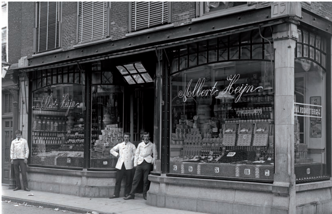
11 Filiaal van Albert Heijn in de voormalige grutterij 'De Koperen Maat', Haarlemmerstraat 188 met hoek Vrouwensteeg, begin twintigste eeuw.

Om de aandacht van de voorbijgangers te trekken en deze te verleiden tot het kopen van zijn artikelen, probeerde de winkelier zijn waren zo aantrekkelijk mogelijk te presenteren. De etalage moest laten zien wat er in de winkel te koop was en werd zorgvuldig ingericht (afb. 8); aanvaardbaar in eenvoudige etalagekasten, maar al snel in