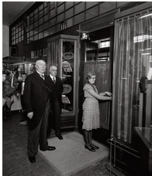
9 Personeel in de winkel van Peek & Cloppenburg in de Breestraat omstreeks 1935,

De relatie tussen de ambachtelijke productie en de verkoop van waren nam af als gevolg van de industrialisatie. Voor nieuwe kleding hoefde men